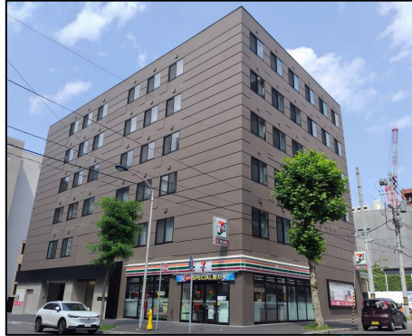
パルム札幌中央ホスピスの外観

札幌市の都心に位置するホテルライクな外観。1階にはセブンイレブンが開店しとても便利になりました。